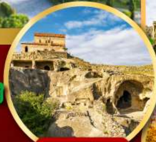
เมืองเก่า อพลิสตีเคห์