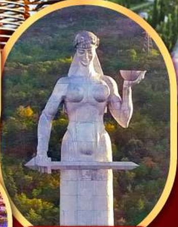
อนุสาวรีย์ มารดาแห่งจอร์เจีย