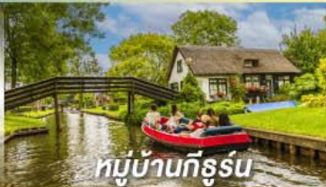
หมู่บ้านทีธูร์น