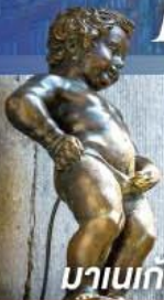
มานเนกันพิส