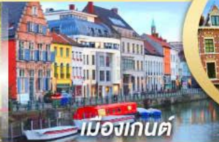
เมืองเกนต์