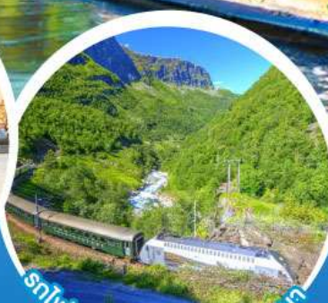
รถไฟสายโรแมนติกฟลัมส์บานา