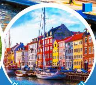
ท่าเรือฮาวน์.โตเปนเฮเกน