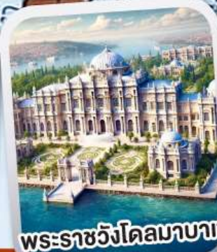
พระราชวังโดลมาบาเซ่