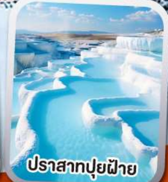
ปราสาทปุยฝาย