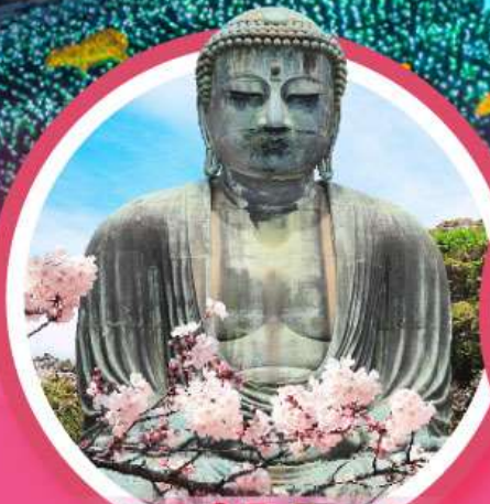
หลวงพ่อดโตโดบุตสึ