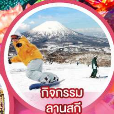
กิจกรรม ลานสกี