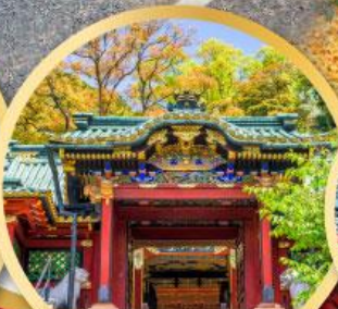
ศาลเจ้าโทโชคุ