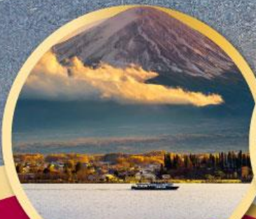
ทะเลสาบคาวากุจิโกะ