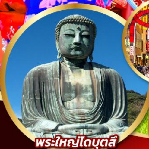
พระใหญ่โตบุตสึ