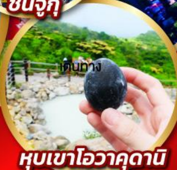
หุบเขาโอวาคูดานิ