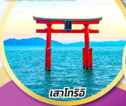
เสาโทริอิ