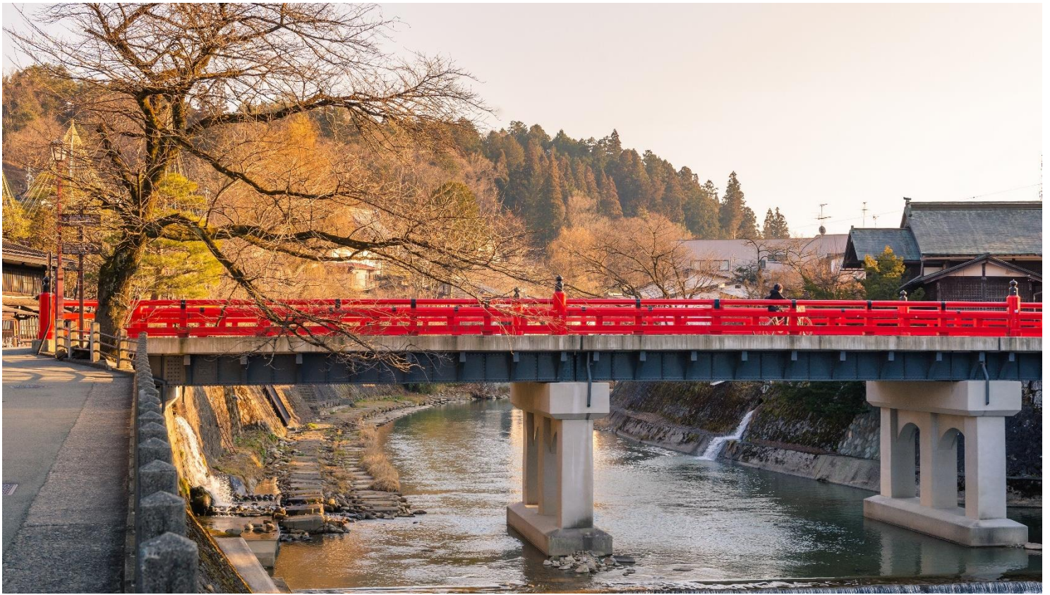
สะพานนากะบาชิ (Nakabashi Bridge) สะพานสีแดง ของย่านเมืองเก่า สะพานทอดข้ามแม่น้ำมิกาวาระที่ไหลผ่านใจกลางเมือง สะพานแห่งนี้ถือเป็นสัญลักษณ์ของเมืองทาคายาม่า