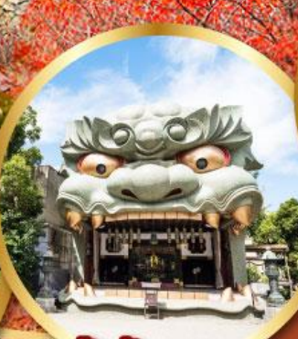
ศาลเจ้านิมะ ยาชากะ