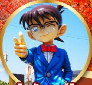
โคนันทาวน์