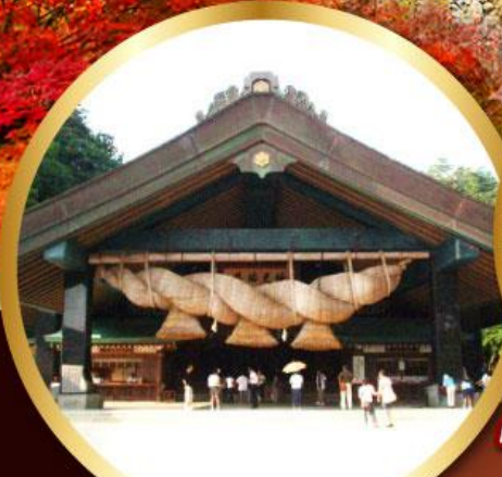
ศาลเจ้าอิชิโมะโกะ