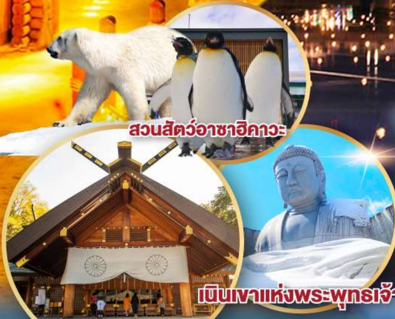
สวนสัตว์อาซาฮิกาวะ