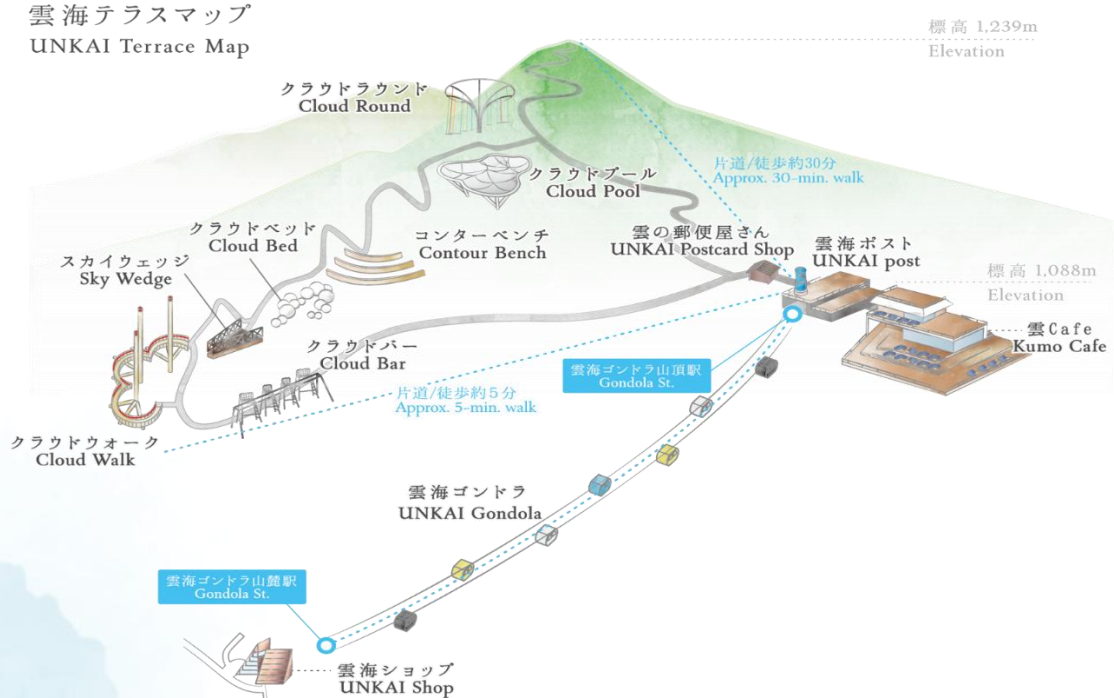
雲海テラスマップ UNKAI Terrace Map

เดินทางสู่ เมืองอาซาฮิดาวา เป็นเมืองที่ใหญ่เป็นอันดับสองของเกาะฮอกไกโด รองจากนครซัปโปโระมีร้านค้าที่ขายข้าวและผักที่ปลูกได้ในเมือง และยังมีร้านขายอาหารทะเลตั้งอยู่มากมาย การคมนาคมสมบูรณ์แบบ ทำให้แต่ละปีมีผู้มาท่องเที่ยวกว่า 5 ล้านคนจากทั้งในและต่างประเทศ