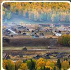
หมู่บ้านเหมู่

สวรรค์ใบไม้เปลี่ยนสี เยือนคานาสีอแดนฝัน มหัศจรรย์หมู่บ้านเหมู่ เเคเคอัวให้อัจฉริยะภูพาน