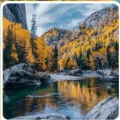
เคอเคอัวไห่