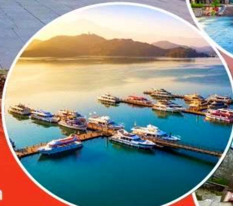
ทะเลสาบสุริยันจันทรา