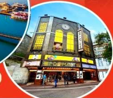
ร้าน POP MART ใหญ่ที่สุดในไต้หวัน