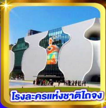
โรงละครแห่งชาติไทเป