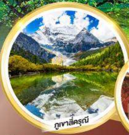
ภูเขาสีดรุณี