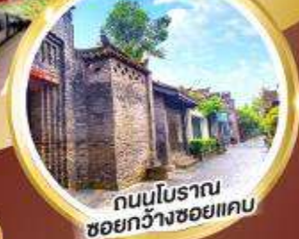
ถนนโบราณ ชอยกว้างชอยแคบ