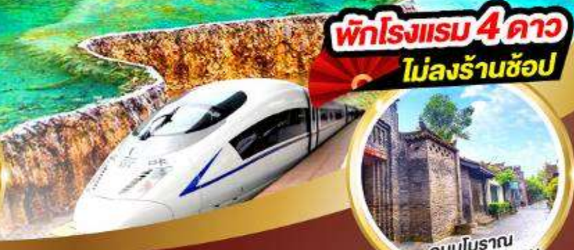
พักโรงแรม 4 ดาว ไม่ลงร้านช้อปปิ้ง