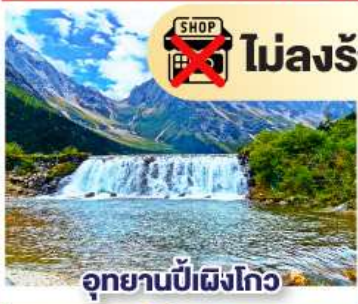
อุทยานปักฝิ่งโกว