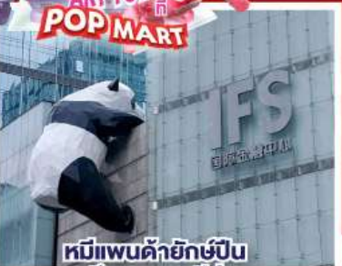
หมีแพนด้ายักษ์ปักฝิ่งโกว ตึกถนนซุนซีลู่

01-06, 02-07, 04-09, 05-10, 07-12 เม.ย. 68 08-13, 09-14 เม.ย. 68 เทศกาลสงกรานต์ 10-15, 12-17, 13-18, 14-29, 15-20 เม.ย. 68 17-22, 18-23, 19-24, 21-26, 22-27, 24-29 เม.ย. 68 27 เม.ย. - 02 พ.ค. 68 / 29 เม.ย. - 04 พ.ค. 68 02-07, 09-14, 11-16, 16-21, 18-23, 23-28 พ.ค. 68 30 พ.ค. - 04 มิ.ย. 68