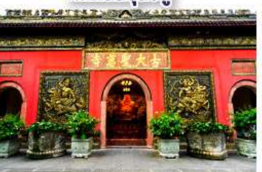
วัดต้าเจี๊ว