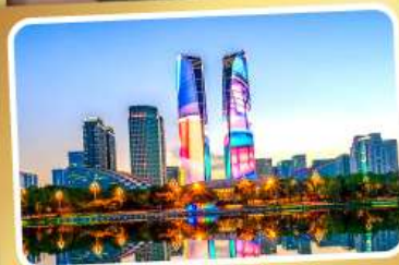
ตึกแฝดเมืองเจิ้งตู