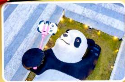
หมีแพนด้าออนเซฟี่