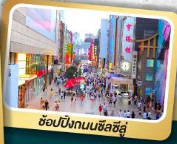
ช้อปปิ้งถนนซิลซิลู่