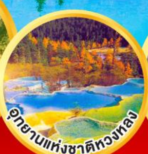
อุทยานแห่งชาติหลวงหลง