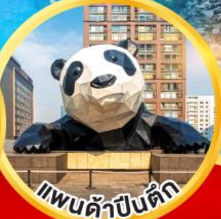
แพนด้าปิ่นตึก