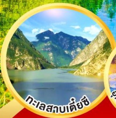
ทะเลสาบเตี้ยซี