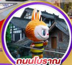
ถนนโบราณ ซอยกว้างซอยแคบ