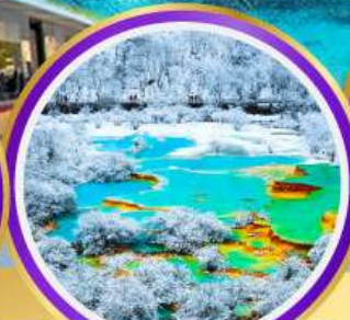
อุทยานหลวงหลง