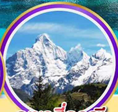
กุเวาสีครุณี