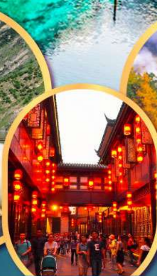
ถนนโบราณจิ้นหลี่