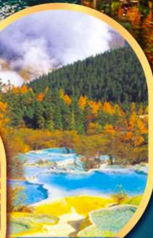
อุทยานหวงหลง