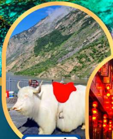
ทะเลสาบเตี้ยซี