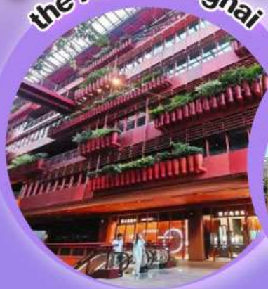
the roof shanghai