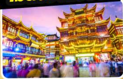
ตลาดร้อยปีเจิ้งหวังเหมียว