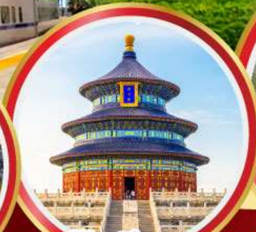
หอฟ้าเทียนถาน กำแพงเมืองจีน