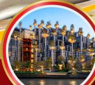
อาคารพินตันไม้