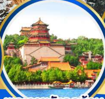
พระราชวังฤดูร้อน อิ๋นโฮหยวน