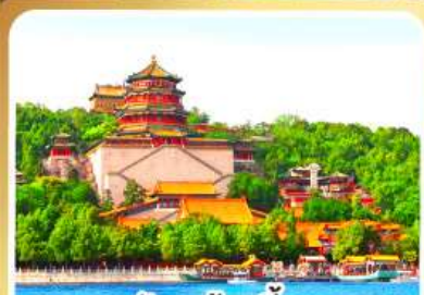
พระราชวังฤดูร้อนอี่เหอหยวน