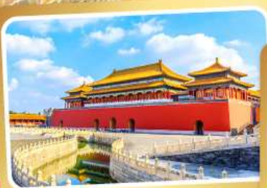
พระราชวังโบราณกู้กิง