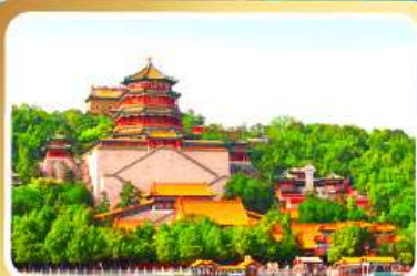
พระราชวังฤดูร้อนอี้เหอหยวน