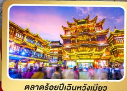
ตลาดร้อยปีเงินหวังเมียว