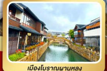
เมืองโบราณผานหลง