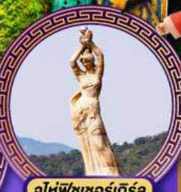
จูไห่พีซเซอร์กิส