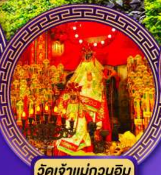
วัดเจ้าแม่กวนอิม ฮ่องฮ่า