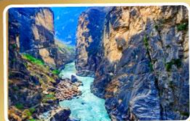
ช่องแคบเสีอกระโจน