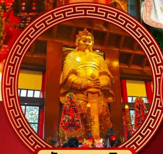
วัดแซกงหมิว