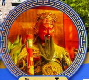
วัดกวนโท