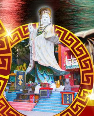
เจ้าแม่กวนอิม หาดริฟส์ลีย์

เมนูสุด พิเศษ!! ต้มช่าฮ่องกง บุฟเฟ่ต์ซาบุดัสโตร์ฮ่องกง, ห่านย่าง