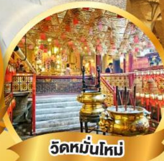
วัดมื่นใหม่