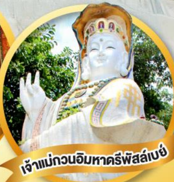
เจ้าแม่กวนอิมหาคีร์พัลลภย์