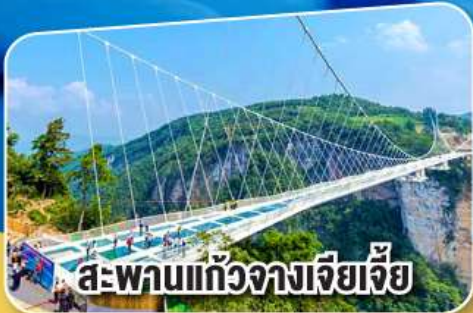
สะพานแก่วางเจียเจีย