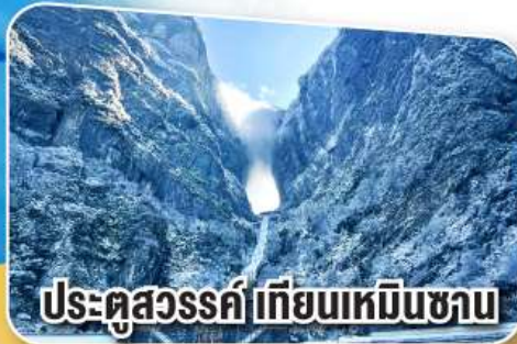
ประตูสวรรค์เทียนเหมินซาน