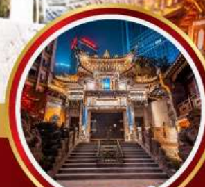
วัดหลัวฮัน