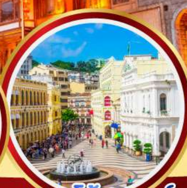
เซนาโต้สแควร์