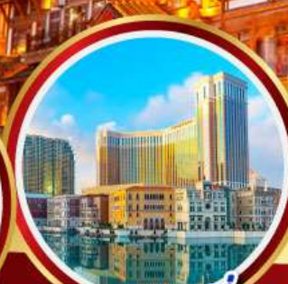
เดอะเวเนเชียน