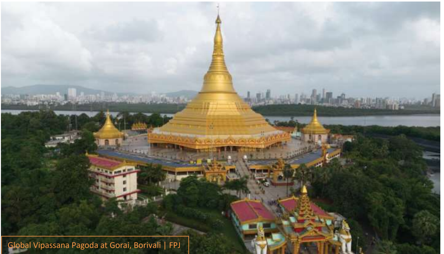
Global Vipassana Pagoda at Gorai, Borivali