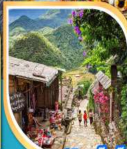
หมู่บ้านก๊ตก๊ต