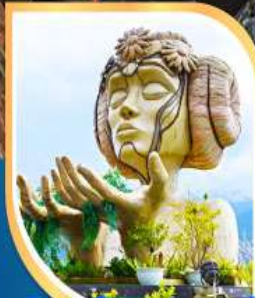
โมอาน่า ซาปา คาเฟ่