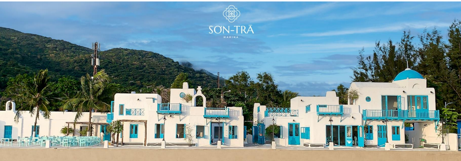
ถ่ายภาพตามอัธยาศัย

นำท่านช้อปปิ้งใน ตลาดฮาน (Han Market) แหล่งรวบรวมสินค้ามากมายเป็นที่นิยมทั้งชาวเวียดนามและชาวไทย สินค้าที่โดดเด่นคือ งานหัตถกรรม เช่น ภาพผ้าปักมืออันวิจิตร โคมไฟ กระเป๋าปัก ตะเกียบไม้แกะสลัก ชุดอ่าวหย่าย (ชุดประจำชาติเวียดนาม) และนอกจากนั้นยังมีสินค้าอีกมากมายให้ท่านได้เลือกซื้อ เช่น เสื้อเวียดนาม ของสด ของแห้ง เสื้อผ้า กาแฟ สินค้าที่ระลึก หมวก รองเท้า กระเป๋า รวมถึงสินค้าพื้นเมือง อีสระให้ท่านได้เลือกซื้อของฝากและ