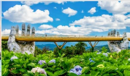
สะพานโกเดินบริดจ์