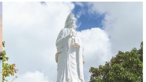
วัดลินฮื่อง

*ทางบริษัทฯ ขอสงวนสิทธิ์ในการสลับโปรแกรมทัวร์ตามความเหมาะสมขึ้นอยู่กับสถานการณ์หน้างาน โดยคำนึงถึงผลประโยชน์ของลูกค้าเป็นสำคัญ