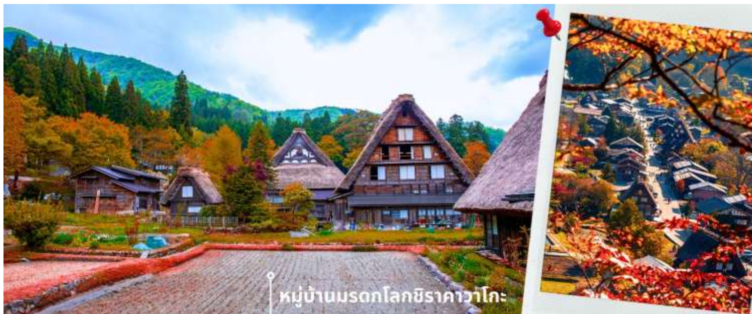
หมู่บ้านมรดกโลกชิราคาวาโกะ

จากนั้นนำท่านเดินทางสู่ เมืองกิฟุ พาท่านเข้าชม หมู่บ้านมรดกโลกชิราคาวาโกะ หมู่บ้านแห่งนี้ ตั้งอยู่ในหุบเขาสูงห่างไกลความเจริญ ทำให้ยังรักษาขนบธรรมเนียม ประเพณีอันดั้งเดิมแบบดั้งเดิมไว้ได้อย่างสมบูรณ์ และเป็นหมู่บ้านที่มีรูปร่างแปลกตาติดอันดับ ซึ่งได้ชื่อว่าเป็น The most beautiful village in Japan โดยมีบ้านทรงแบบ “ กัสโซ ” ซึ่งเป็นบ้านชาวนาโบราณที่มีอายุมากกว่า 250 ปี คำว่า กัสโซ มีความหมายว่า พนมมือ ซึ่งคล้ายกับรูปแบบของบ้านที่มีหลังคามุงด้วยฟางข้าวที่ทำมุมชันถึง 60 องศา ราวกับสองมือที่ประนมเข้าหากัน ตัวบ้านมีความยาวประมาณ 18 เมตร กว้าง 10 เมตร ทั้งหลังถูกสร้างขึ้นโดยไม่ใช้ตะปู ภายหลังในปี 1995 ได้รับการตั้งขึ้นเป็นมรดกโลก