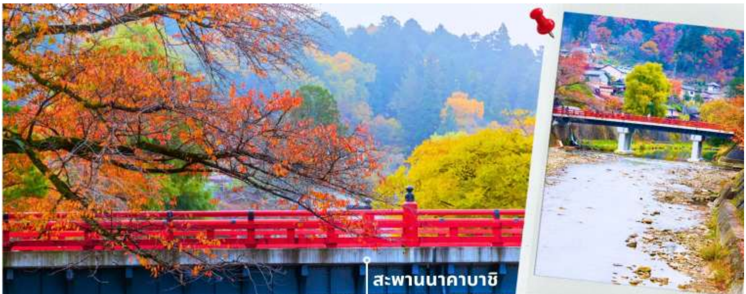
** ระยะเวลาการเปลี่ยนสีขอใบไม้จะขึ้นอยู่กับสายพันธุ์และสภาพอากาศ **

เที่ยง รับประทานอาหารเที่ยง ณ ภัตตาคาร (2) เมนูพิเศษ เซ็ตหมย่างไบโฮบะ จากนั้นนำท่านเดินทางสู่ เมืองทาคายาม่า ซึ่งเป็นเมืองเล็กๆ ที่ตั้งอยู่ในจังหวัดกิฟุ ที่ห้อมล้อมไปด้วยภูเขาและธารน้ำใส พาท่านแวะถ่ายรูปและชมวิวที่ สะพานนาคาบาชิ เป็นสะพานที่สามารถเห็นได้ชัดอย่างโดดเด่นจากสีที่แดงเข้ม อีกทั้ง สะพานแห่งนี้ยังถือเป็นสัญลักษณ์ที่สำคัญจุดหนึ่งของเมือง โดยเฉพาะใบไม้เปลี่ยนสีที่จะมีใบไม้สีส้มสดใสสะพรั่งอยู่ราย ล้อมตัวสะพาน จนกลายเป็นจุดชมวิวยอดนิยมแห่งหนึ่งของเมืองทาคายาม่า