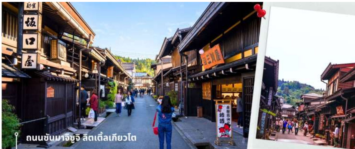
ถนนซันมาจิซุจิ ลิตเติ้ลเกียวโต

จากนั้นให้เวลาท่านเดินเล่นสัมผัสบรรยากาศกันต่อที่ ถนนซันมาจิซุจิ ซึ่งถูกขนานนามว่าเป็น “ ลิตเติ้ลเกียวโต ” บ้านไม้โบราณโทนสีน้ำตาลดำ เรียงรายไปตามทางเดิน มีคูน้ำอยู่รอบเมือง ปัจจุบันได้มีการปรับเปลี่ยนเป็นร้านค้า ร้านอาหารของที่ระลึก สำหรับนักท่องเที่ยวให้ได้เลือกชมทั้ง ผ้าแฮนด์เมด ชูดยูกาตะ ตุ๊กตาซารุโอะโอะ