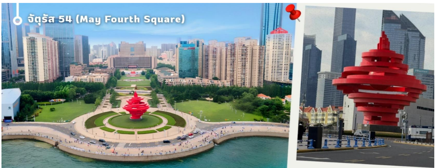
จัตุรัส 54 (May Fourth Square)

นำท่านเดินทางสู่ จัตุรัส 54 แลนด์มาร์กสำคัญและสัญลักษณ์ประจำเมืองชิงเต่า ตั้งอยู่ริมอ่าวฝูซาน โดดเด่นด้วยประติมากรรมสีแดงขนาดยักษ์ "สายลมแห่งเดือนพฤษภาคม" ซึ่งสร้างขึ้นเพื่อรำลึกถึงขบวนการ 4 พฤษภาคม อันเป็นเหตุการณ์สำคัญในประวัติศาสตร์จีน นักท่องเที่ยวสามารถเดินเล่นริมทะเล ชมวิวเมืองสมัยใหม่ และสัมผัสบรรยากาศอันสวยงามของอ่าวฝูซาน โดยเฉพาะในช่วงค่ำที่มีการเปิดไฟประดับทั่วบริเวณ ถือเป็นจุดชมวิวยอดนิยมและถ่ายภาพที่มีชื่อเสียงที่สุดแห่งหนึ่งของเมืองชิงเต่า