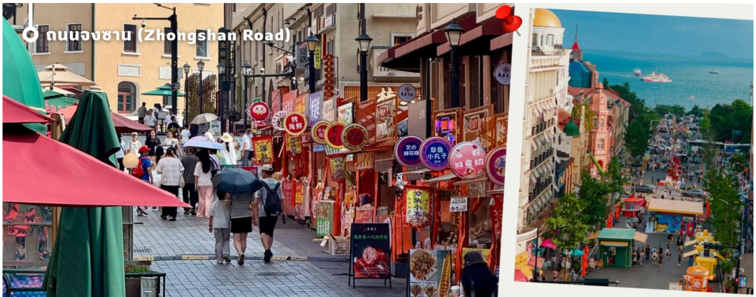
ถนนจงซาน (Zhongshan Road)

นำท่านชม ถนนจงซาน (Zhongshan Road) ย่านการค้าเก่าแก่และถนนสายประวัติศาสตร์ที่ได้รับการขนานนามว่าเป็น “ถนนแม่แห่งเมืองชิงเต่า” โดดเด่นด้วยอาคารสถาปัตยกรรมสไตล์ยุโรปอันสวยงามที่ผสมผสานเสน่ห์ของอดีตและความทันสมัยได้อย่างลงตัว เพลิดเพลินกับการเลือกซื้อสินค้าแฟชั่น สินค้าท้องถิ่น และของฝากจากร้านค้าชื่อดังมากมายตลอดสองข้างทาง พร้อมสัมผัสบรรยากาศสุดโรแมนติก เหมาะแก่การเดินเล่น ถ่ายภาพเช็คอิน และเก็บความประทับใจท่ามกลางเมืองท่าริมทะเลที่มีเสน่ห์แห่งนี้