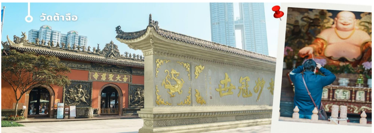
วัดต้าจื่อ

นำท่านชม วัดต้าจื่อ พระอารามแห่งพระถังซำจั๋ง ใจกลางนครเฉิงตู พระถังซำจั๋ง ได้รับการสรรเสริญว่าเป็นผู้มีความเพียร และมีชื่อเสียงมายาวนานกว่า 1,400 ปี และยังได้รับการยกย่องว่าเป็น พระไตรปิฎกแห่งราชวงศ์ถัง พุทธประวัติของพระถังซำจั๋งถูกจารึกในสถานที่ต่างๆมากมาย รวมไปถึงได้ถูกกล่าวถึงในจดหมายเหตุหลายเล่ม ตามเส้นทางการเดินทางแห่งความเพียรของท่าน รวมทั้งมีพระอัฐิของท่าน ประดิษฐานอยู่ในพระอารามของนครนานจิง และที่ทะเลสาบสุริยันจันทราเป็นเกาะใต้หวนอีกด้วย