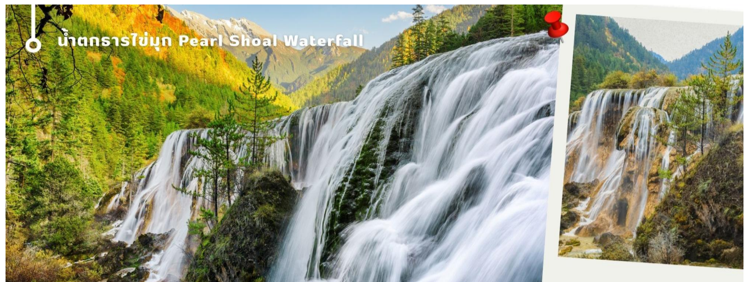
น้ำตกธารไข่มุก Pearl Shoal Waterfall