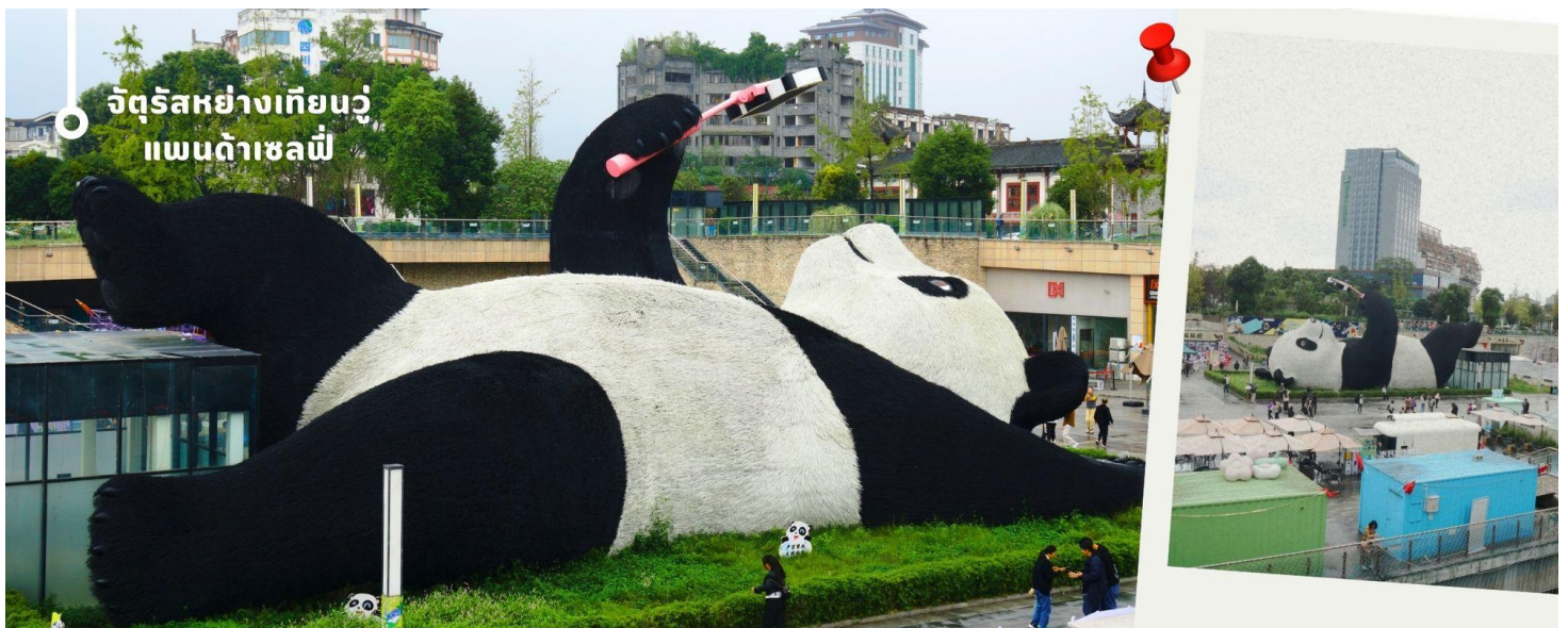
จัตุรัสหย่างเทียนวู แพนด้าเซลฟี่

หลังรับประทานอาหารเช้า นำท่านเที่ยวชม จัตุรัสหย่างเทียนวู เป็นจุดเช็คอินที่สำคัญสำหรับคนที่มาเที่ยวที่ เมืองตูเจียงเยียน บริเวณจุดตัดห้า อำเภอตูเจียงเยียน นครเฉิงตู ไฮไลท์ของจัตุรัสหย่างเทียนวู คือ ประติมากรรม แพนด้ายักษ์ที่กำลังนอนหงายท้อง ยื่นมือถือไม้เซลฟี่สีชมพู ซึ่งออกแบบโดยนักออกแบบชื่อดัง Florentijn Hofman รูปปั้นแพนด้ายักษ์มีความยาว 26 เมตร กว้าง 11 เมตร สูง 12 เมตร และหนัก 130 ตัน แบบท่าทางสบายๆของแพนด้าที่ความประทับใจและรอยยิ้มให้กับผู้ที่มาเยือนจัตุรัสหย่างเทียนวู สามารถดึงดูดนักท่องเที่ยวได้เป็นจำนวนมากเลยทีเดียว เป็นการแสดงออกด้วยภาษาทางศิลปะแบบหนึ่งที่สะท้อนชีวิตในท้องถิ่น มอบความรู้สึกสนิทสนมและมีความสุขกับผู้ชม อิสระเดินชมถ่ายภาพ รูปปั้นแพนด้าเซลฟี่ ตามอัธยาศัย ที่นี่เป็นจุดเช็คอินที่เหมาะสมสำหรับทุกเพศทุกวัย หากคุณกำลังมองหาสถานที่ท่องเที่ยวใหม่ๆ ที่เต็มไปด้วย ความทรงจำดีๆ จัตุรัสหย่างเทียนวู คือคำตอบที่สมบูรณ์แบบ