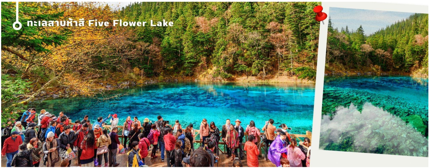
ทะเลสาบห้าสี Five Flower Lake

หนึ่งในจุดที่สวยงามและนักท่องเที่ยวแวะมาเยี่ยมชมเยอะที่สุด ตั้งอยู่ที่ความสูงเหนือระดับน้ำทะเลประมาณ 2,472 เมตร น้ำลึกประมาณ 5 เมตร น้ำใสมองเห็นพื้นด้านล่างของทะเลสาบ สีของผิวน้ำสวยงามแปลกตา โดยเฉพาะเมื่อยามแสงอาทิตย์สาดส่องกระทบผิวน้ำ สีของน้ำในทะเลสาบจะสะท้อนเป็นสีส้มถึง 5 เฉดสี สวยงามสะกดตา ซึ่งสาเหตุที่ทำให้เกิดสีสันต่างๆ นี้มาจากการสะสมของแร่ธาตุ และพืชน้ำชนิดต่างๆ โดยจะมีสีสันแตกต่างกันไปตามฤดูกาลและช่วงเวลา ยิ่งถ้ามาในช่วงฤดูหนาว ต้นไม้ริมทะเลสาบจะเต็มไปด้วยหิมะสีขาวตัดกับสีของทะเลสาบ ดูสวยงามแปลกตา