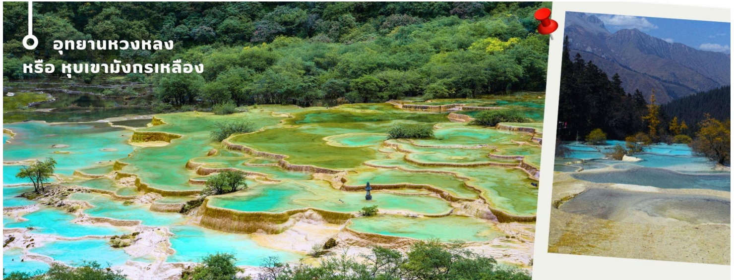
อุทยานหวงหลง หรือ หุบเขามังกรเหลือง

ช่วงเดือนตุลาคมการเปลี่ยนสีของใบไม้ และการตกของหิมะขึ้นอยู่กับสายพันธุ์และสภาพอากาศ