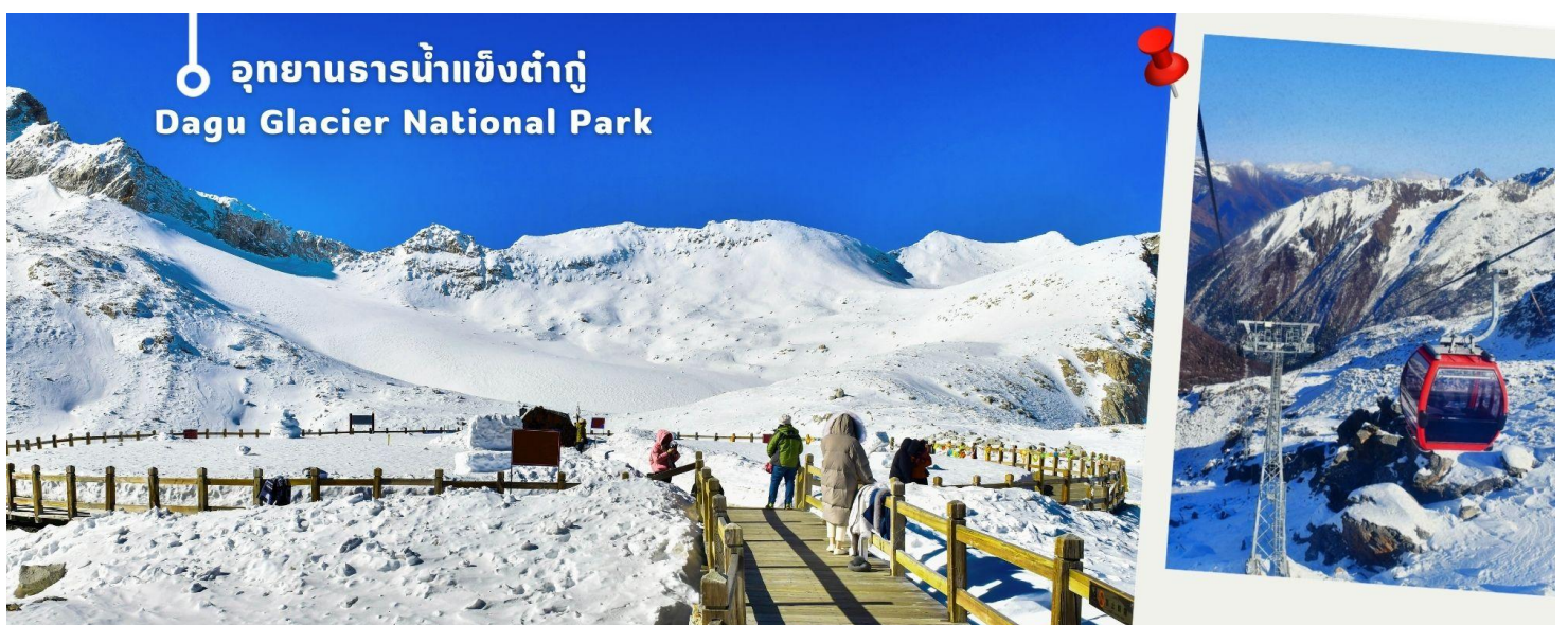
อุทยานธารน้ำแข็งต้ากู่ Dagu Glacier National Park

จากนั้นนำท่านเดินทางสู่ เมืองเฮยซู่ (ใช้เวลาเดินทางประมาณ 2 ชั่วโมง)เพื่อเดินทางไปยัง อุทยานธารน้ำแข็งต้ากู่ (รวมกระเช้าขึ้นลง) ต่ากู่ปิงชว่น หรือ Dagu Glacier National Park เป็นธารน้ำแข็งที่สวยงามที่สุดแห่ง