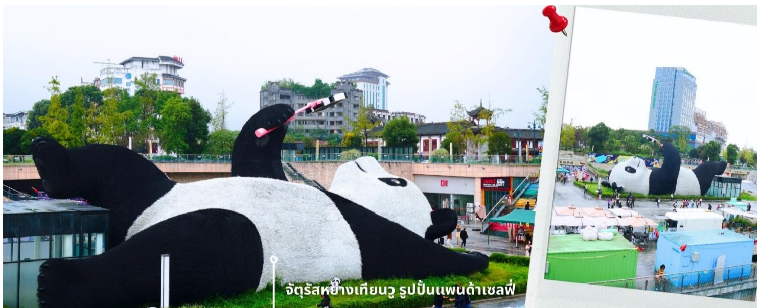
จัตุรัสหยางเทียนวู รูปปั้นแพนด้าเซลฟี่

นำท่านเที่ยวชม จัตุรัสหยางเทียนวู เป็นจุดเช็คอินที่สำคัญสำหรับคนที่มาเที่ยวที่ เมืองตูเจียงเยียน บริเวณจุดท่าข้าม อำเภอตูเจียงเยียน นครเฉิงตู ไฮไลท์ของจัตุรัสหยางเทียนวู คือ ประติมากรรม แพนด้ายักษ์ที่กำลังนอนหงายท้อง ยื่นมือถือไม้เซลฟี่สีชมพู ซึ่งออกแบบโดยนักออกแบบชื่อดัง Florentijn Hofman รูปปั้นแพนด้า ยักษ์มีความยาว 26 เมตร กว้าง 11 เมตร สูง 12 เมตร และหนัก 130 ตัน แบบท่าทางสบายๆของแพนด้าที่สร้างความประทับใจและ รอยยิ้มให้กับผู้ที่มาเยือนจัตุรัสหยางเทียนวู สามารถดึงดูดนักท่องเที่ยวได้เป็นจำนวนมากเลยทีเดียว เป็นการ แสดงออกด้วยภาษาทางศิลปะแบบหนึ่งที่สะท้อนชีวิตในท้องถิ่น มอบความรู้สึกสนิทสนมและมีความสุขกับผู้ชม อิสระเดินชมถ่ายภาพ รูปปั้นแพนด้าเซลฟี่ ตามอัธยาศัย ที่นี่เป็นจุดเช็คอินที่เหมาะสมสำหรับทุกเพศทุกวัย หากคุณ กำลังมองหาสถานที่ท่องเที่ยวใหม่ๆ ที่เต็มไปด้วย ความทรงจำดีๆ จัตุรัสหยางเทียนวู คือคำตอบที่สมบูรณ์แบบ