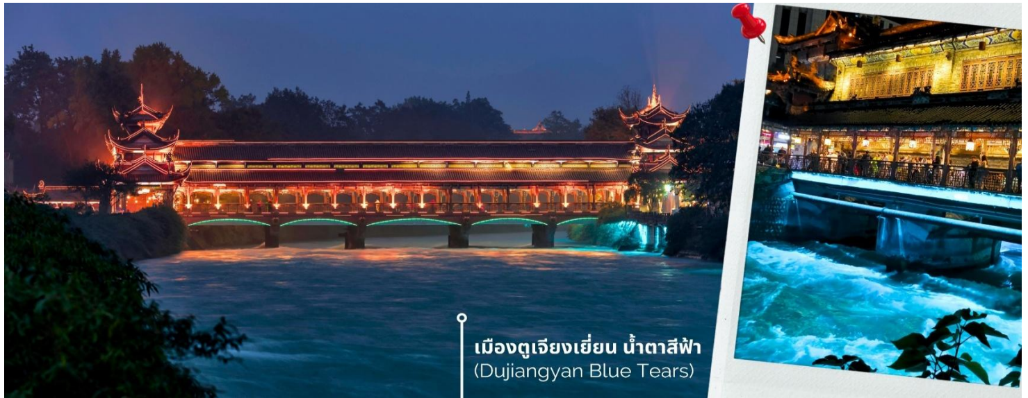
เมืองตูเจียงเยี่ยน น้ำตาสีฟ้า (Dujiangyan Blue Tears)