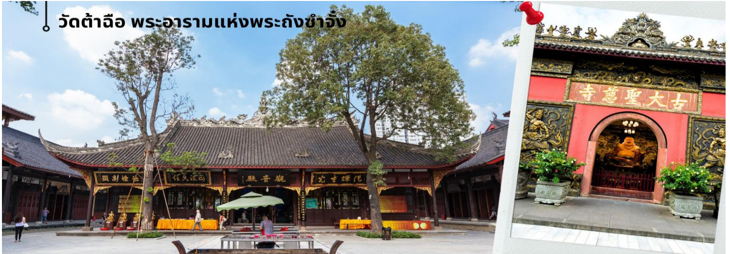
วัดต้าฉือ พระอารามแห่งพระถังซำจั๋ง

นำท่านเดินทางกลับเฉิงตู นำท่านชม วัดต้าฉือ พระอารามแห่งพระถังซำจั๋ง เจากลางนครเฉิงตู พระถังซำจั๋ง ได้รับการสรรเสริญว่าเป็นผู้มีความเพียร และมีชื่อเสียงมายาวนานกว่า 1,400 ปี และยังได้รับการยกย่องว่าเป็นพระไตรปิฎกแห่งราชวงศ์ถัง พุทธประวัติของพระถังซำจั๋งถูกจารึกในสถานที่ต่างๆมากมาย รวมไปถึงได้ถูกกล่าวถึงในจดหมายเหตุหลายเล่ม ตามเส้นทางการเดินทางแห่งความเพียรของท่าน รวมทั้งมีพระอัฐิของท่าน ประดิษฐานอยู่ในพระอารามของนครนานจิง และที่ทะเลสาบสุริยันจันทราเป็นเกาะใต้หวั่นอีกด้วย