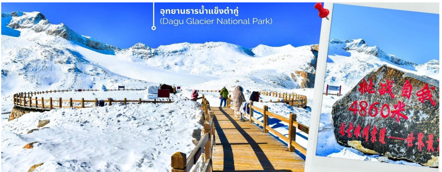
การตกและความหนาวของหิมะขึ้นอยู่กับสภาพอากาศ

จากนั้นนำท่านเดินทางสู่ เมืองเฮยฮุย (ใช้เวลาเดินทางประมาณ 2 ชั่วโมง) เพื่อเดินทางไปยัง อุทยานธารน้ำแข็งต้ากู่ปิงชว่น(รวมกระเช้าขึ้นลง) ต้ากู่ปิงชว่น หรือ Dagu Glacier National Park เป็นธารน้ำแข็งกลาเซียร์ที่สวยงามที่สุดแห่งหนึ่งของโลก และเป็นสถานที่ท่องเที่ยวระดับ 4A ของจีน ตั้งอยู่ที่เมืองเฮยฮุย ในมณฑลเสฉวน ห่างจากเมืองเฉิงตูประมาณ 300 กิโลเมตร ถือเป็นธารน้ำแข็งที่อายุน้อยที่สุด ที่ตั้งอยู่ในระดับความสูงที่ต่ำที่สุด และอยู่ใกล้กับเมืองมากที่สุดในบรรดาธารน้ำแข็งทั้งหมด โดยอยู่สูงจากระดับน้ำทะเลประมาณ 3,800-5,100 เมตร จุดสูงที่สุดที่นักท่องเที่ยวสามารถขึ้นไปได้จะอยู่ที่ 4,860 เมตร