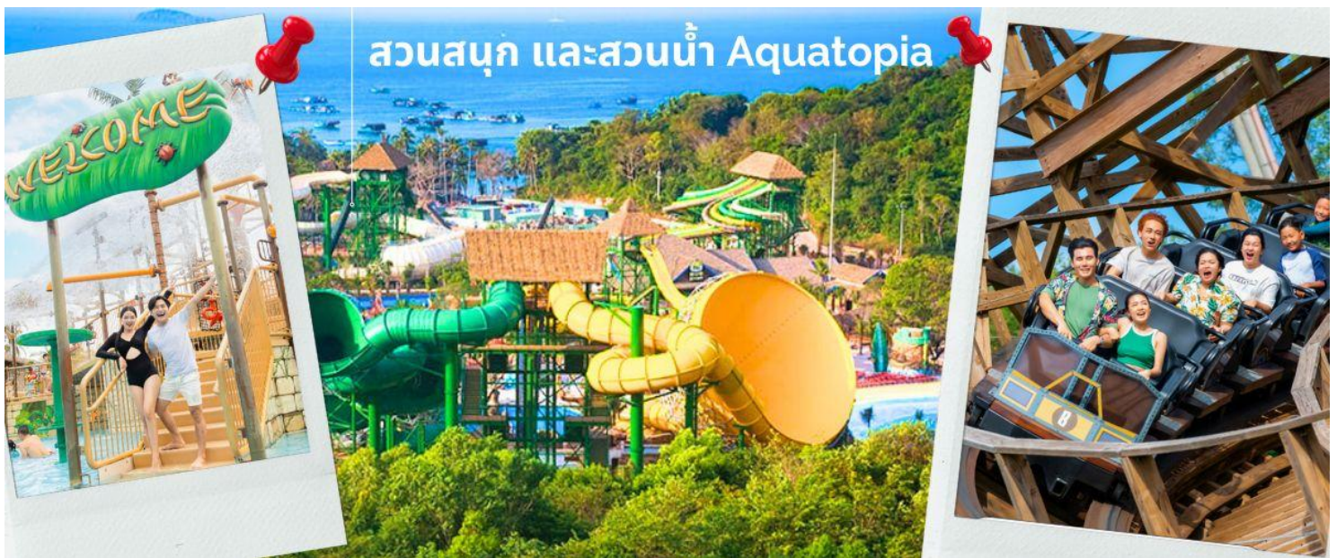
เป็นฉากที่น่าประทับใจ

อีกหนึ่งมุมที่ไม่ควรพลาดเมื่อท่านมาเยือนเกาะแห่งนี้ นั่นคือ ชายหาดฮอนเทิม (Hon Thom) ชายหาดทรายสีขาว ทอดยาวรับแสงอาทิตย์ทำให้เกิดบรรยากาศที่แสนอบอุ่น และสวยงาม เพิ่มความโรแมนติกให้กับชายหาดแห่งนี้ได้อีกด้วย สมควรแก่เวลา นำท่านนั่งกระเช้ากลับจาก เกาะฮอนเทิม (Hon Thom) พร้อมชมจุดไฮไลท์แลนด์มาร์คอีกแห่งของเกาะฟูโก๊วก นั่นคือ สะพานจูบ หรือ Kiss Bridge เป็นโครงการสัญลักษณ์ใหม่ของการท่องเที่ยวเวียดนาม ถือเป็นจุดเช็คอินใหม่ ที่ออกแบบโดยสถาปนิก Marco Casamonti ผสมผสานวัฒนธรรมเวียดนามและภาพวาด "The Creation Of Adam" (พระเจ้าสร้างอาดัม) โดยศิลปินชื่อดัง Michelangelo ความพิเศษของสะพานแห่งนี้คือตรงกลางสะพานจะมีช่องว่างกว้างประมาณ 50 ซม. ถือเป็นระยะห่างระหว่างคนสองคนก่อนจูบหรือจับมือเพื่อแสดงมิตรภาพ จึงถูกเรียกชื่อว่า "สะพานจูบ" ด้วยลักษณะของสะพานที่ยื่นออกไปในทะเล ด้านทิศตะวันตกของเกาะ ในช่วงเย็นจึงได้เห็นภาพพระอาทิตย์ตกดินทำให้เกิด