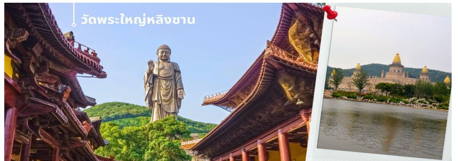
ในโลก เป็นพระพุทธรูปปางยืนของพระอมิตาภพุทธะแบบสัมฤทธิ์กลางแจ้ง หนักกว่า 7,000 เมตริกตัน สร้างเสร็จเมื่อ

เช้า 🍷 รับประทานอาหารเช้า ณ ห้องอาหารโรงแรม (3) นำท่านชม วัดพระใหญ่หลังซาน (นั่งรถราง) ตั้งอยู่ที่เมืองอู่ซี มณฑลเจียงซู ประเทศจีน สิ่งให้เห็นแบบเด่นชัดเมื่อมาเที่ยวที่วัดนี้คือ "หลังซานต้าฝอ" หรือ "พระใหญ่หลังซาน" พระพุทธรูปองค์ใหญ่ที่สุดองค์หนึ่งในประเทศจีนและ