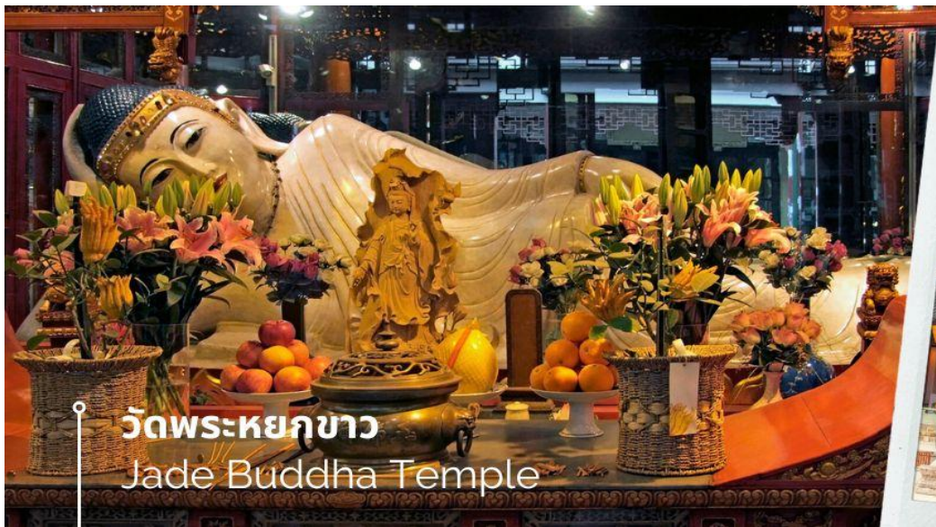
วัดพระหยกขาว Jade Buddha Temple

นำท่านชม วัดพระหยกขาว Jade Buddha Temple เป็นวัดที่มีชื่อเสียงมากที่สุดในเมืองเซียงไฮ้ ซึ่งเป็นที่รู้จักจากพระพุทธรูปสององค์ที่สร้างขึ้นจากหยกทั้งแท่ง องค์พระพุทธรูปปางนั่งมีความสูง 190 เซนติเมตร และ หุ้มด้วยเพชรพลอย หิน มโนรา และ มรกต และองค์พระพุทธรูปปางไสยาสน์ มีความยาว 96 เซนติเมตร นอนเอียงด้านขวาและหนุนพระเศียรด้วยพระหัตถ์ขวา ถือเป็นวัดที่มีทั้งชาวจีนและนักท่องเที่ยวเดินทางมาสักการะบูชาตลอดทั้งวัน