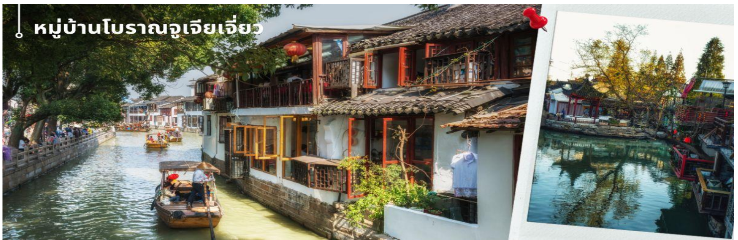
หมู่บ้านโบราณจูเจี๋ยเจี๋ย

📍รับประทานอาหารกลางวัน ณ ภัตตาคาร (4) เมนูพิเศษ ขาหมูร่ำรวย