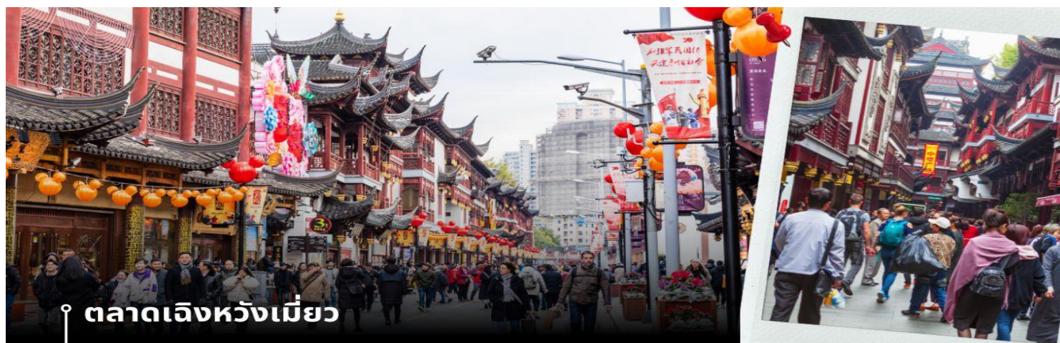
ตลาดเจินหวังเมี่ยว

นำท่านเดินทางสู่ หมู่บ้านโบราณจูเจี๋ยเจี๋ย มีฉายาว่า เวนิซตะวันออกแห่งเมืองเซี่ยงไฮ้ เป็นอีกหนึ่งย่านเก่าริมน้ำที่มีชื่อเสียงในเซี่ยงไฮ้ มีประวัติศาสตร์ยาวนานกว่า 1700 ปี ซึ่งพื้นที่ทั้งหมดได้รับการอนุรักษ์ไว้เป็นอย่างดี จุดเด่นของเมืองโบราณแห่งนี้คือพื้นที่ด้านในนั้นมีแม่น้ำหลากหลายสายเชื่อมโยงไปยังพื้นที่ต่างๆ โดยรอบ ทำให้มีบรรยากาศที่สวยงามและร่มรื่น และให้ท่าน ล่องเรือ ชมวิวบ้านเรือนเก่าแก่ริมน้ำ ได้เวลาอันสมควรเดินทางสู่ มหานครเซี่ยงไฮ้ จากนั้นนำท่านสู่ ตลาดโบราณ 100 ปี เจินหวังเมี่ยว เป็นศูนย์รวมสินค้า และอาหารพื้นเมืองที่แสดงถึงเอกลักษณ์ของชาวเซี่ยงไฮ้ซึ่งมีการผสมผสานระหว่างอดีตและปัจจุบันได้อย่างลงตัว ซึ่งเป็นย่านสินค้าราคาถูกที่มีชื่ออีกย่านหนึ่งของนครเซี่ยงไฮ้ ให้ท่านอิสระช้อปปิ้งตามอัธยาศัย