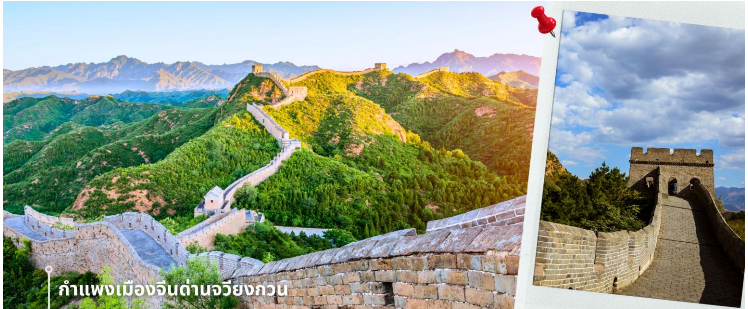
กำแพงเมืองจีนด้านจิวหยงกวน

กรุงปักกิ่งมีการรุกรานจากชนเผ่าเร่ร่อน ด้านจิวหยงกวนมีสถาปัตยกรรมที่สวยงามของศิลปะจีน จากยอดด่าน สามารถมองเห็นทิวทัศน์ที่สวยงามของเทือกเขาและธรรมชาติโดยรอบ นับว่าเป็น 1 ใน 8 จุดชมวิวที่มีชื่อเสียงของปักกิ่งมาตั้งแต่สมัยราชวงศ์จิ้น