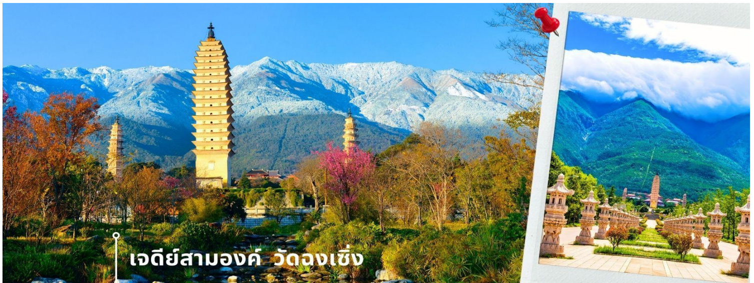
เจดีย์สามองค์ วัดฉงเซิง

จากนั้นผ่านชม เจดีย์สามองค์ สัญลักษณ์ของเมืองต้าหลี่ ตั้งอยู่ใน วัดฉงเซิง (Chongsheng Temple) วัดเก่าแก่ที่สร้างขึ้นเมื่อศตวรรษที่ 9 นับว่าเป็นหนึ่งในเจดีย์ที่สูงที่สุดในประเทศจีน อีกทั้งยังมีความศักดิ์สิทธิ์เป็นอย่างมาก ว่ากันว่าเป็นหนึ่งในสิ่งก่อสร้างเพียงไม่กี่แห่งที่ไม่ถูกทำลายจากเหตุการณ์แผ่นดินไหวในเมืองต้าหลี่เมื่อปี ค.ศ. 1925 จึงกลายเป็นสถานที่เคารพศรัทธาของชาวต้าหลี่เป็นอย่างมาก