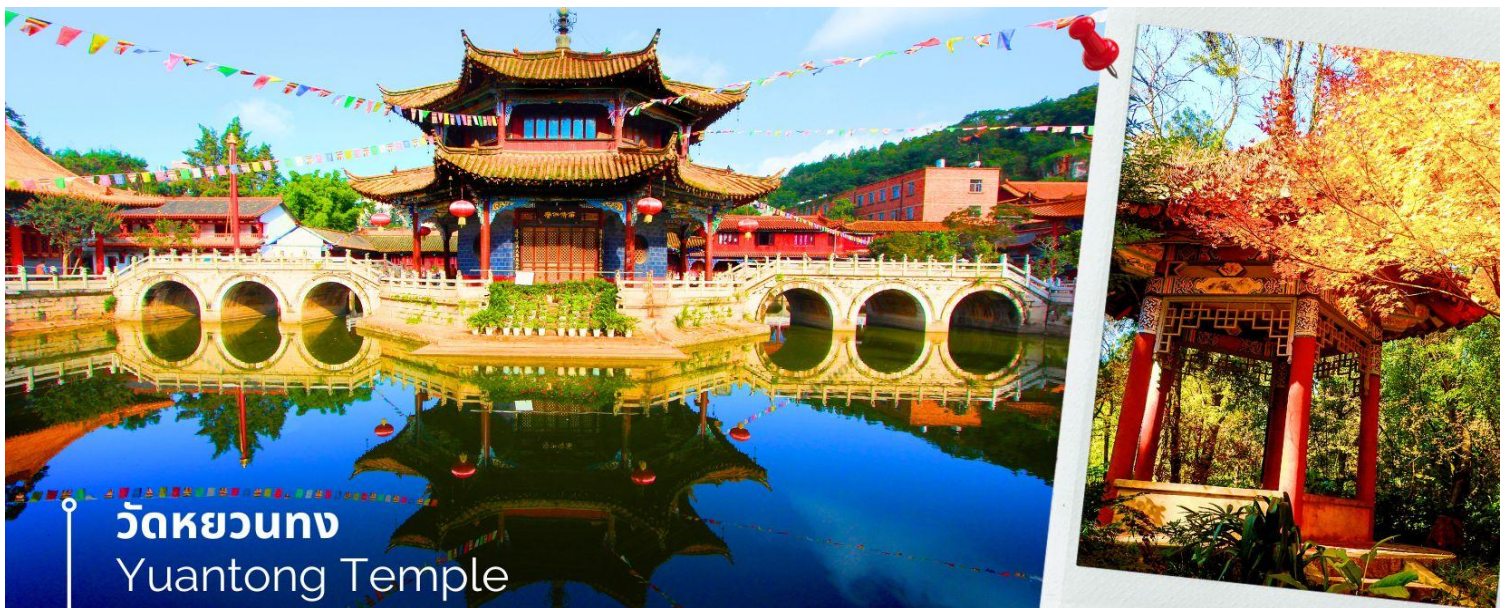
วัดหยวนตง Yuantong Temple

เช้า 🍷 รับประทานอาหารเช้า ณ ห้องอาหารโรงแรม (15) นำท่านชม วัดหยวนตง (Yuantong Temple) วัดแห่งนี้เป็นวัดที่ใหญ่และเก่าแก่ที่สุดในเมืองคุนหมิง สร้างมาตั้งแต่สมัยราชวงศ์ถัง มีอายุยาวนานประมาณ 1,200 กว่าปี การสร้างวัดแห่งนี้จะแปลกตากว่าวัดอื่นในจีน เพราะปกติแล้วการสร้างวัดของจีนส่วนมากจะต้องสร้างอยู่บนภูเขา แต่วัดหยวนตงสร้างวัดต่ำกว่าภูเขา โดยวิหารจะอยู่ต่ำที่สุดเนื่องจากวัดแห่งนี้ไม่ได้สร้างขึ้นเพื่อเป็นวัดโดยตรง แต่เคยเป็นศาลเจ้าแม่กวนอิมมาก่อน