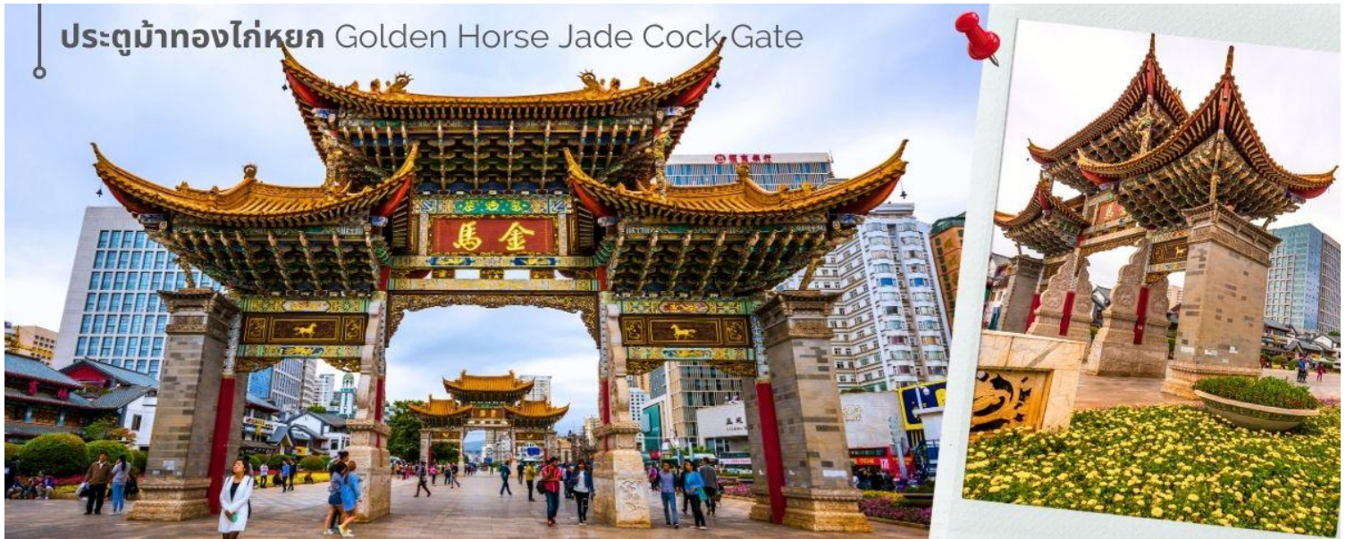
ประตูม้าทองไก่หยก Golden Horse Jade Cock Gate

ค่ำ 🍷 รับประทานอาหารค่ำที่ภัตตาคาร (14) 🏠 เดินทางเข้าที่พัก LONGWAY HOTEL ระดับ 4 ดาวหรือเทียบเท่า