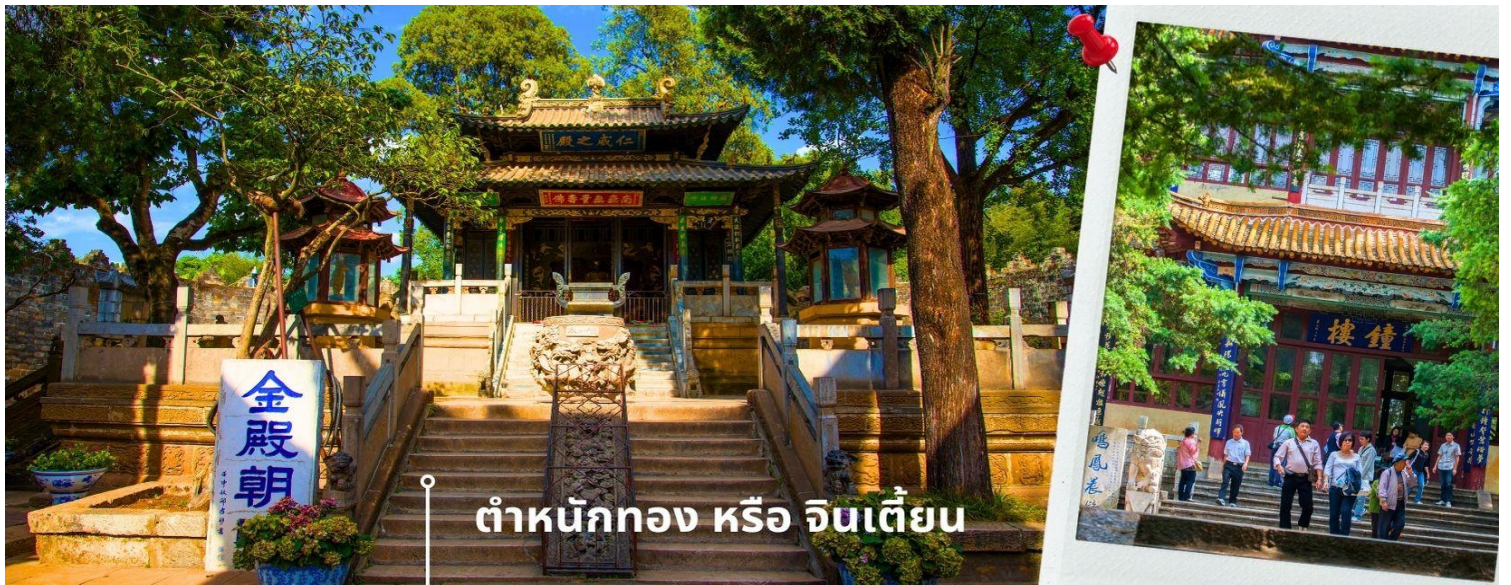
ตำหนักทอง หรือ จินเตียน

นำท่านเยี่ยมชม ตำหนักทอง หรือ จินเตียน (The Golden Temple Park | Jindian park) (ไม่รวมค่ารถ แบตเตอรี่ 15 หยวน/ท่าน) โบราณสถานสำคัญของมณฑลยูนนาน ที่ได้รับการปกป้องดูแลโดยรัฐบาลจีน ตั้งอยู่บริเวณ เชิงเขาหมิงเฟิง ล้อมรอบด้วยแนวกำแพงและหอคอยเหมือนเป็นป้อมปราการ ตำหนักทองถูกเรียกตามลักษณะอาคารที่ มีสีทองอร่าม จากทองเหลืองในส่วนของผนังและหลังคา รวมกว่า 200 ตัน โดยถือเป็นสิ่งปลูกสร้างด้วยสัมฤทธิ์ที่ใหญ่ ที่สุดของจีน ภายในมีรูปปั้นทองโดยมีเงินอยู่ (เสวียนอยู่) เทพเจ้าลัทธิเต๋าเป็นองค์ประธาน