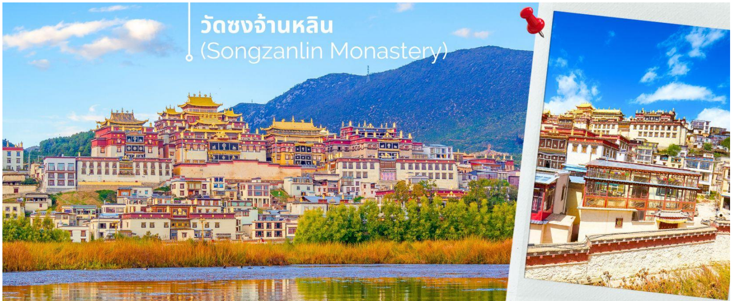
วัดซงจ้านหลิน (Songzanlin Monastery)

นำท่านชม วัดซงจ้านหลิน เป็นวัดลามะที่ใหญ่ที่สุดของมณฑล ยูนนานทางภาคตะวันตกเฉียงใต้ของจีน ถูกสร้างขึ้นในปี ค.ศ.1679 อยู่ห่างจากตัวเมืองเซียงกรีล่า 5 กิโลเมตร วัดนี้เป็นอีกหนึ่งสถานที่ท่องเที่ยวสำคัญของเมืองเซียงกรีล่า ประเทศจีน ถ้ามาเที่ยวเซียงกรีล่าแล้วไม่ได้แวะมาวัดซงจ้านหลินก็ถือว่ายังไม่มาถึงเซียงกรีล่า ด้านนอกวัดสามารถถ่ายรูปได้ แต่ภายในอาคารวัดห้ามถ่ายรูป จากนั้นเดินทางสู่ เมืองลี่เจียง