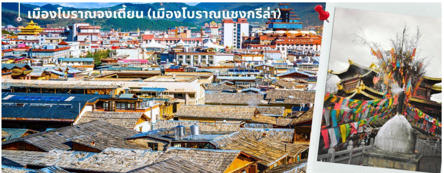
📍 เมืองโบราณจงเตี้ยน (เมืองโบราณเซงกรี่ล่า)

นำท่านชม เมืองโบราณจงเตี้ยน (เมืองโบราณเซงกรี่ล่า) ตั้งอยู่ในเขตปกครองตนเองชนชาติทิเบต ตีซิง ทางตะวันตกเฉียงเหนือของมณฑลยูนนาน ที่ราบสูงทางภาคตะวันตกเฉียงใต้ของประเทศจีน มีชนชาติส่วนน้อย 25 ชนชาติอาศัยกันอยู่ อาทิ ชนชาติทิเบต ลีซอ น่าซี ไป และอี เป็นต้น ศูนย์รวมของวัฒนธรรมชาวทิเบต ลักษณะคล้ายชุมชนเมืองโบราณทิเบต ซึ่งเต็มไปด้วยร้านค้าของคนพื้นเมือง ร้านขายสินค้าที่ระลึกมากมาย