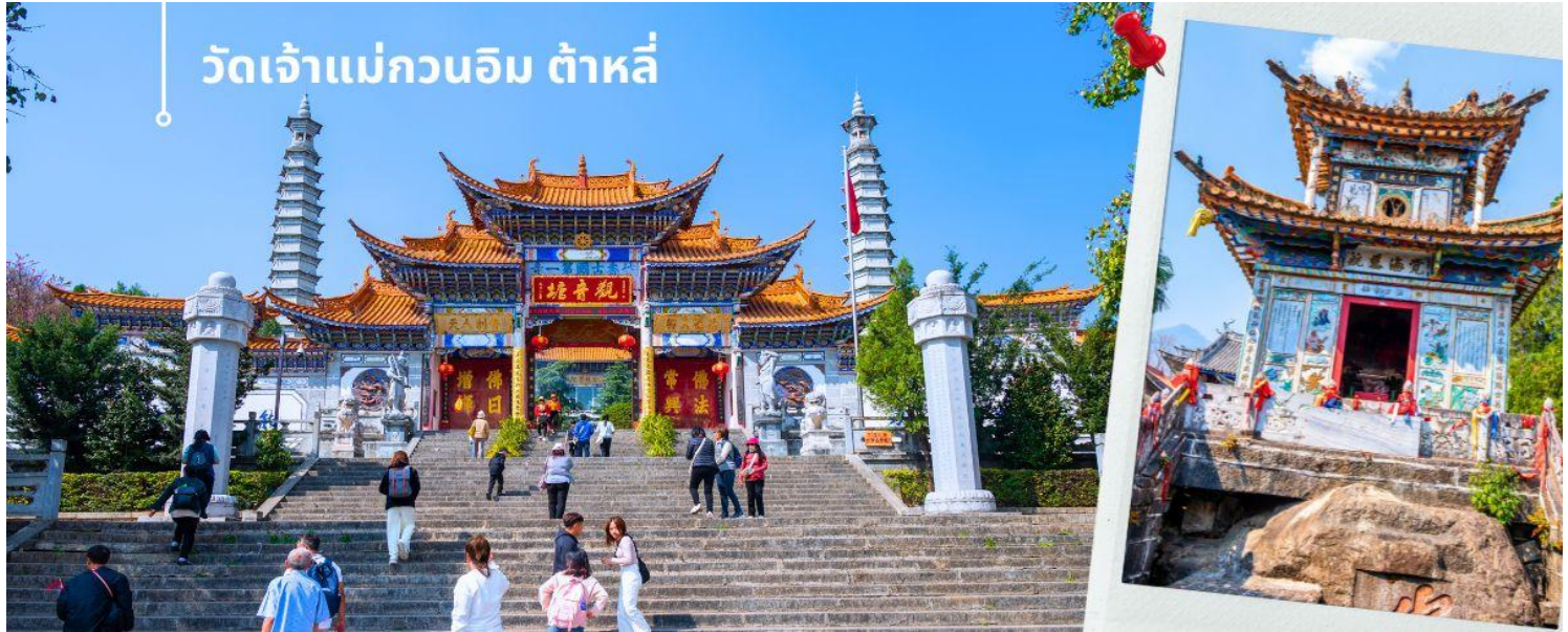
วัดเจ้าแม่กวนอิม ต้าหลี่

จากนั้นนำท่านชม วัดเจ้าแม่กวนอิม ตามตำนานเล่าว่าเจ้าแม่กวนอิมได้แปลงกายเป็นหญิงชราแบกก้อนหินใหญ่ไว้บนหลังเพื่อให้ทหารของฝ่ายตรงข้ามได้เห็นเมื่อทหารฝ่ายศัตรูได้เห็นว่ามีแต่หญิงชรายังแข็งแรงถึงเพียงนี้ ถ้าเป็นคนวัยหนุ่มสาวจะต้องมีพลังกำลังมากมายยากที่จะต่อสู้ จึงทำให้ไม่ทำการเข้าโจมตีเมืองและถอยทัพกลับไป ชาวเมืองจึงสร้างวัดแห่งนี้ขึ้นในสมัยราชวงศ์ถัง ซึ่งถือว่าเป็นวัดที่มีประติมากรรมยอดเยี่ยมแห่งหนึ่งในต้าหลี่