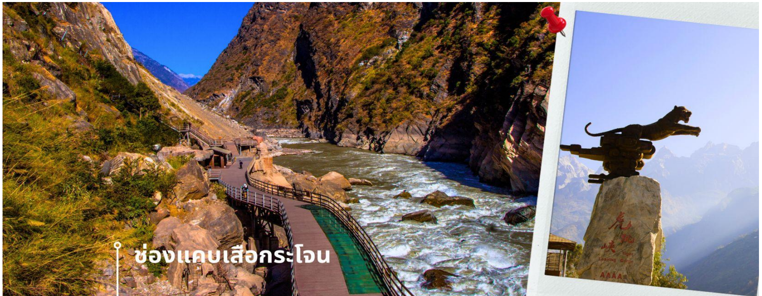
📍 ช่องแคบเสือกระโจน

เขาเสือกระโจนเป็นหนึ่งในหุบเขาเหนือแม่น้ำที่ลึกที่สุดในโลก โดยมีจุดที่ลึกที่สุดระหว่างแม่น้ำถึงยอดเขาประมาณ 3,790 เมตร บริเวณนี้มีผู้อยู่อาศัยเพียงเล็กน้อย ส่วนใหญ่เป็นชนพื้นเมืองชาวหน่าซี โดยจะอาศัยอยู่ในหมู่บ้านเล็ก ๆ บริเวณใกล้เคียง และหาเลี้ยงชีพโดยการเพาะปลูกและรับจ้างนำทางคนต่างถิ่น