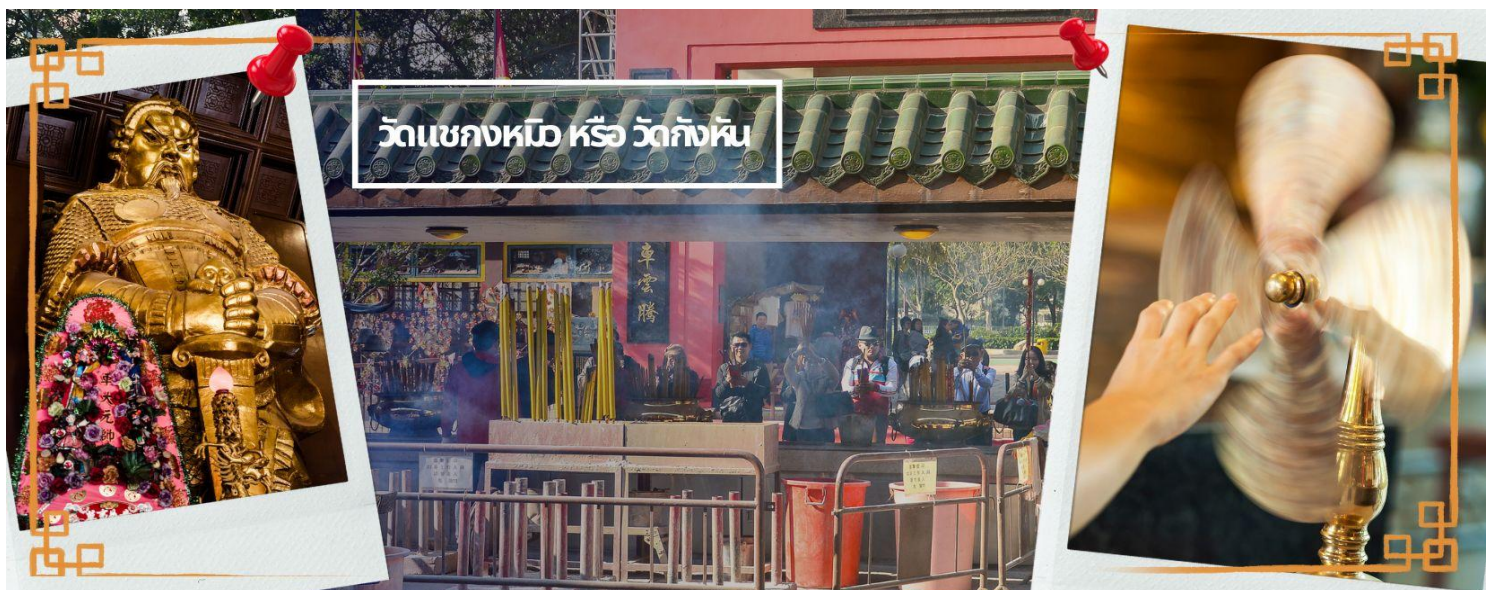
วัดแขกหนือ หรือ วัดกังหัน

นำท่านเดินทางสู่ วัดแขก ที่ซาถิ้น (CHE KUNG TEMPLE AT SHA TIN) วัดแขกสร้างขึ้นเพื่อเป็นอนุสรณ์เพื่อรำลึกถึงตำนานแห่งนักรบราชวงศ์ซ่ง มีนามว่า “แซ กง” แม่ทัพปราบศึก ผู้คนทั่วทุกดินแดนต่างยำเกรงในกำลังพลอันกล้าหาญแข็งแกร่งของแม่ทัพแขก ตั้งอยู่ในเขต SHATIN มีประวัติเล่าต่อกันมาว่า ขณะที่แม่ทัพปราบศึกอยู่นั้น ทุกแคว้นเขตแดนแผ่นดินใหญ่ต่างก็ยำเกรงต่อกำลังพลที่กล้าหาญในกองทัพของท่าน ยามที่ออกรบเพื่อต้านข้าศึกศัตรูทุกทิศทาง ทุก ๆ ครั้ง ท่านใช้สัญลักษณ์รูปกังหัน 4 ใบพัดติดไว้ด้านหลังรถศึกนำขบวนในกองทัพ เหล่าทหารกล้ามีความเชื่อว่าเมื่อพกพาสัญลักษณ์รูปกังหันนี้ไป ณ ที่ใด ๆ กังหันนี้ก็จะช่วยเสริมสิริมงคล นำพาแต่ความโชคดี มีอำนาจเข้มแข็ง เสริมกำลังใจให้แก่กองทัพของท่าน ชื่อเสียงในการนำทัพสู้ศึกของท่านจึงเป็นตำนานมาจนทุกวันนี้ ปัจจุบันวัดแขก จึงเป็นสถานที่สักการะเคารพ ขอพร ท่านแขก โดยมีสัญลักษณ์เป็นกังหันนำโชคนั่นเอง ☯ การหมุนกังหันนำโชคที่ตั้งอยู่ในวัด เพื่อจะได้หมุนเวียนชีวิตของเราและครอบครัวให้มีความเจริญก้าวหน้าด้านหน้าที่การงาน