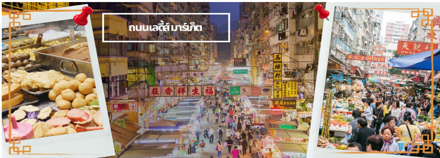
ถนนเลดี้มาร์เก็ต

นำท่านเดินทางเข้าสู่ที่พัก RAMADA GRAND HOTEL/BEST WESTERN PLUS HOTEL ★★★★★ หรือเทียบเท่า ★★★★★ หรือเทียบเท่า