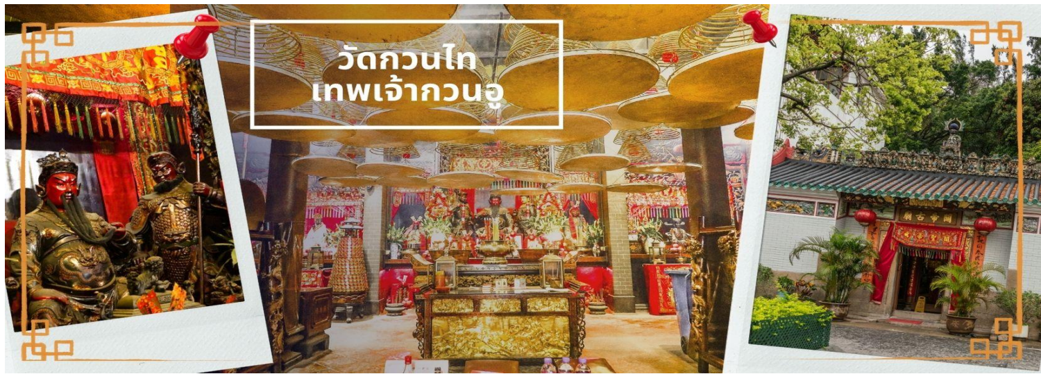
วัดกวนโ เทพเจ้ากวนอู

จากนั้นนำท่าน ไหว้ขอพรเรื่องเดินทาง การติดต่อ ค้าขาย วัดเจ้าแม่ทับทิมทินหัว (Tin Hau Temple) ที่ Yau Ma Tei เป็นวัดเก่าแก่ขนาดเล็ก อายุกว่า 150 ปี มีต้นกำเนิดมาจากวัดเล็กๆ ใน พื้นที่ตลาด Kwun Chung เคยเป็นหมู่บ้านชาวประมงมาก่อน ตั้งแต่ปี 1864 เป็นวัดที่อุทิศให้กับทินโหว่ (หมาโจ้ เทพเจ้าแห่งท้องทะเล) มีบรรยากาศที่สงบ ร่มรื่น ติดกับสวนสาธารณะเล็ก ๆ และนักท่องเที่ยวยังไม่พลุกพล่านมากจุดเด่นที่แนะนำคือ การปิดทองเรือมังกร เพื่อการทำงานการค้า ธุรกิจ ให้เจริญรุ่งเรือง