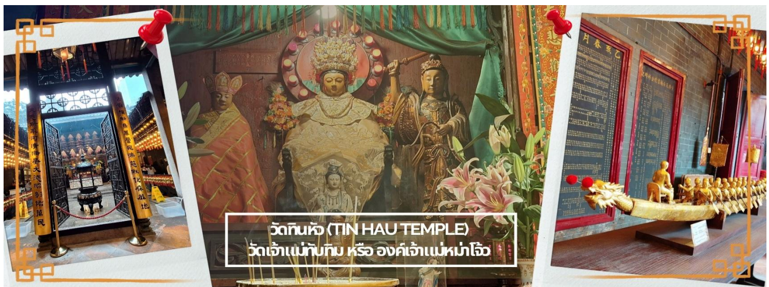
วัดทินหัว (TIN HAU TEMPLE) วัดเจ้าแม่ทับทิม หรือ องค์เจ้าแม่หมาโจ้

จากนั้นนำท่าน ไหว้ขอพรเรื่องเดินทาง การติดต่อ ค้าขาย วัดเจ้าแม่ทับทิมทินหัว (Tin Hau Temple) ที่ Yau Ma Tei เป็นวัดเก่าแก่ขนาดเล็ก อายุกว่า 150 ปี มีต้นกำเนิดมาจากวัดเล็กๆ ใน พื้นที่ตลาด Kwun Chung เคยเป็นหมู่บ้านชาวประมงมาก่อน ตั้งแต่ปี 1864 เป็นวัดที่อุทิศให้กับทินโหว่ (หมาโจ้ เทพเจ้าแห่งท้องทะเล) มีบรรยากาศที่สงบ ร่มรื่น ติดกับสวนสาธารณะเล็ก ๆ และนักท่องเที่ยวยังไม่พลุกพล่านมากจุดเด่นที่แนะนำคือ การปิดทองเรือมังกร เพื่อการทำงานการค้า ธุรกิจ ให้เจริญรุ่งเรือง