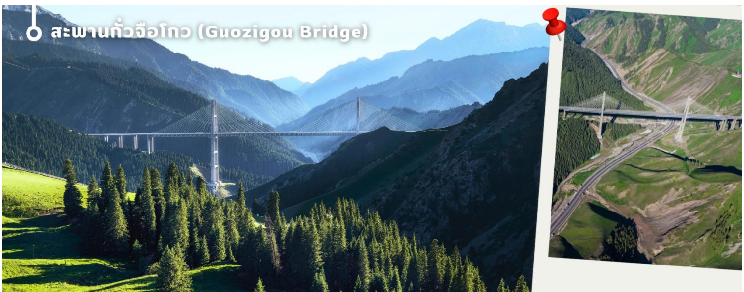
สะพานกัวจื่อโกว (Guozigou Bridge)

โดยรอบเป็นทุ่งหญ้ากว้างใหญ่ โดยเฉพาะช่วงเดือนพฤษภาคม-สิงหาคม จะเขียวขจีและเต็มไปด้วยดอกไม้ป่า พร้อมฝูงวัว แกะ และม้า อีกทั้งยังเป็นพื้นที่ที่ยังคงวิถีชีวิตและวัฒนธรรมของชนเผ่าเร่ร่อน เช่น คาซัค มองโกล และอุยกูร์ ให้นักเดินทางทุกท่านสามารถเพลิดเพลินกับกิจกรรมหลากหลาย เช่น ชีม้าชมวัว ปิกนิกริมทะเลสาบ ชมพระอาทิตย์ขึ้น-ตก และดูดาวยามค่ำคืน ท่ามกลางบรรยากาศธรรมชาติที่เงียบสงบและงดงาม จากนั้นนำทุกท่านเดินทางไปยัง เมืองอีหนิง (Yining) เมืองหลวงของเขตปกครองตนเองอีลีคาซัค ในซินเจียง ทางตะวันตกเฉียงเหนือของจีน เป็นศูนย์กลางวัฒนธรรมที่มีความหลากหลายทางชาติพันธุ์ โดยเฉพาะชาวอุยกูร์และชาวคาซัค เมืองนี้มีชื่อเสียงด้านทิวทัศน์และธรรมชาติที่สวยงาม เช่น ทุ่งลาเวนเดอร์กว้างใหญ่ พร้อมเสน่ห์ของดนตรีพื้นเมืองและวิถีชีวิตท้องถิ่น อีกทั้งที่นี่ยังเป็นหนึ่งในจุดหมายสำคัญบนเส้นทางสายไหม ที่นักเดินทางทั่วโลกจะได้สัมผัสทั้งธรรมชาติและวัฒนธรรมในที่เดียว ระหว่างทางนำทุกท่าน ผ่านชม สะพานกัวจื่อโกว (Guozigou Bridge) สะพานซึ่งขนาดใหญ่ที่ทอดข้ามหุบเขาในเขตซินเจียง หนึ่งในแลนด์มาร์คสำคัญบนเส้นทางสาย G30 ได้รับฉายาว่า “ประตูสู่เทือกเขาเทียนชาน” ระหว่างทางท่านจะได้ชมวิวสะพานที่ทอดยาวท่ามกลางภูเขาและหุบเขาอันงดงามตระการตา ใช้เวลาเดินทางโดยประมาณ 2.5 ชั่วโมง