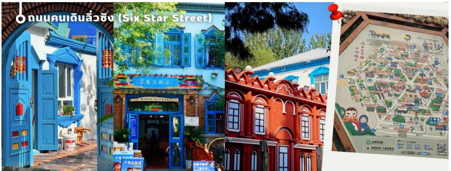
ถนนคนเดินลิวซิง (Six Star Street)

จากนั้นนำทุกท่านเพลิดเพลินกับ ถนนคนเดินลิวซิง (Six Star Street) แลนด์มาร์คสำคัญของเมืองอีหนิง สร้างขึ้นตั้งแต่ปี ค.ศ. 1934 โดยออกแบบเป็นผังรูปดาว 6 แฉก ภายในเต็มไปด้วยบ้านสไตล์ซินเจียงสีสดใส โดดเด่นด้วยผนังสีฟ้า หลังคาสีชมพู และสวนดอกไม้ที่สวยงาม ให้บรรยากาศราวกับเมืองในเทพนิยาย ที่นี่สะท้อนความหลากหลายทางวัฒนธรรมของชาวอุยกูร์ คาซัค หุย และรัสเซีย นักท่องเที่ยวสามารถชมการแสดงพื้นเมือง ฟังดนตรีซินเจียงจากหีบ